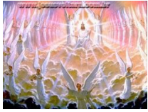
Apocalipse 21.4 Leia Apocalipse

Este último livro do Novo Testamento é o relato da revelação que o apóstolo João recebeu quando estava preso na ilha de Patmos (1.9). Muitos capítulos deste livro são extremamente difíceis de se interpretar. Alguns dos maiores teólogos da História da Igreja sentiram-se incapazes de interpretar este livro. João Calvino, por exemplo, um dos grandes reformadores, escreveu um comentário de cada livro da Bíblia, menos do Apocalipse. Entretanto, embora o significado de todas as partes deste livro não seja claro, permanece ainda a promessa de que aqueles que o lerem serão abençoados (1.3). E embora algumas partes possam ser obscuras, certas idéias aparecem com clareza inquestionável. Os capítulos 1 a 3, que são a descrição de Jesus, tal como apareceu a João, e o registro das mensagens a serem enviadas às sete igrejas da Ásia Menor são bem claros em seu significado. Os capítulos de 4 a 18 são mais difíceis, mas os capítulos de 19 a 22, que tratam dos acontecimentos pelos quais Deus trará a redenção final ao mundo, são claros na sua maior parte, e de extrema importância para completar a história da redenção esboçada desde o Gênesis.